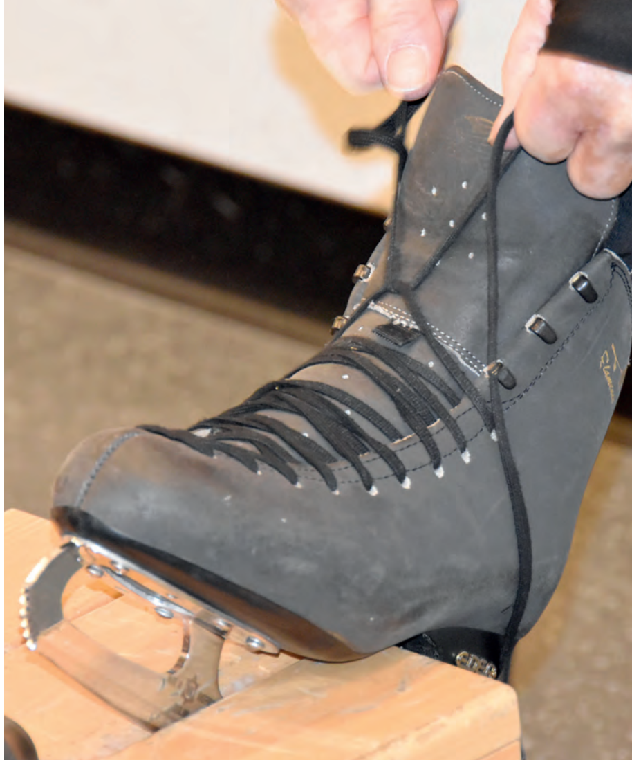
Schlittschuhe für das Eistanzen ähneln jenen für das Eiskunstlaufen.