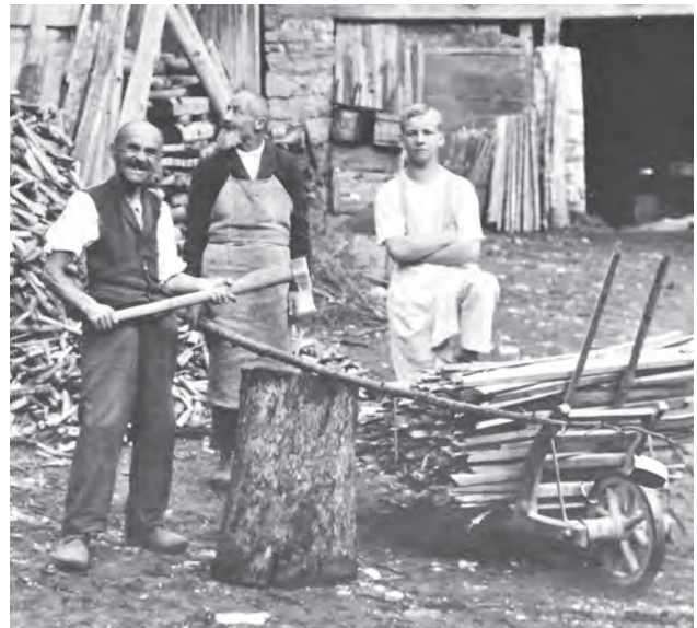
Holzaufbereitung für den Backofen im Innenhof der Wohltätigkeitsanstalt Valduna, um 1940.