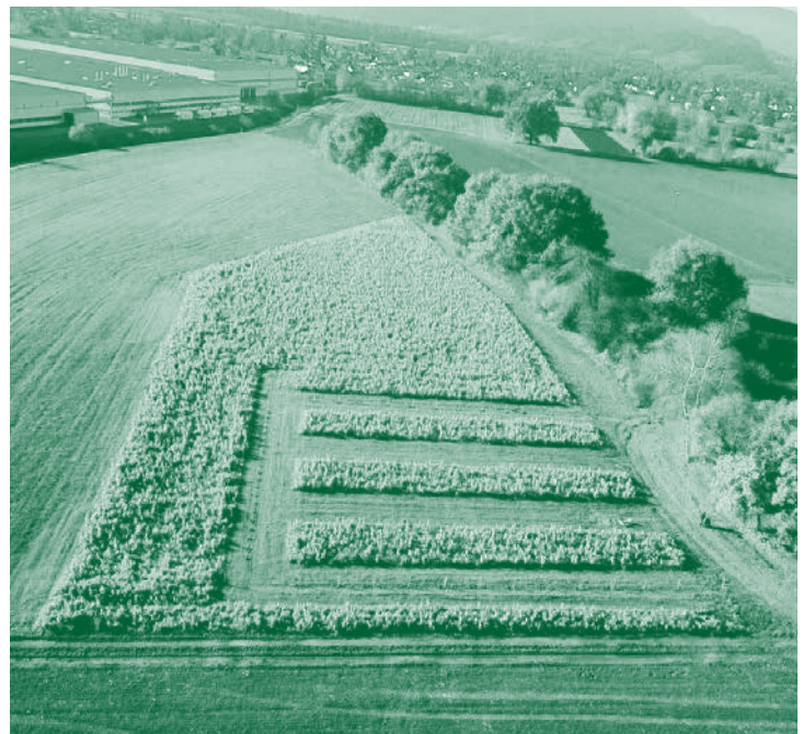
Die Pachtflächen in Rankweil

Der Acker ist in Brederis in Nähe des Maldinahofs, direkt an der neuen Radroute Feldkirch – Koblach. Für Schnellentschlossene gibt es bis Ende März noch einige Parzellen zum Pachten, Interessenten melden sich am besten direkt bei mir: arnold.feuerstein@gmail.com oder unter T 0664 4036671.