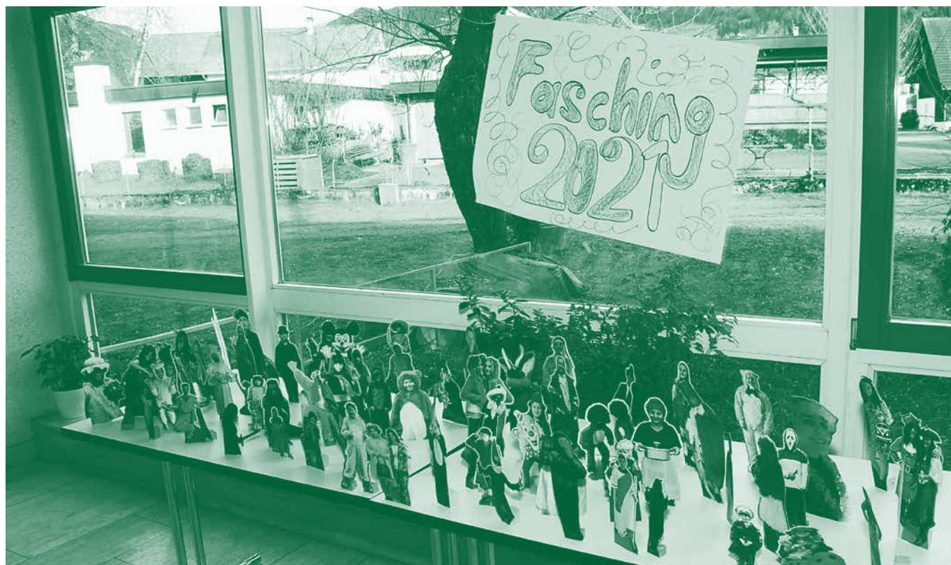
Bastelarbeit statt Faschingsfeier: Mit solchen Aktionen wurde während der Lockdowns der Kontakt zu Schüler*innen gehalten.