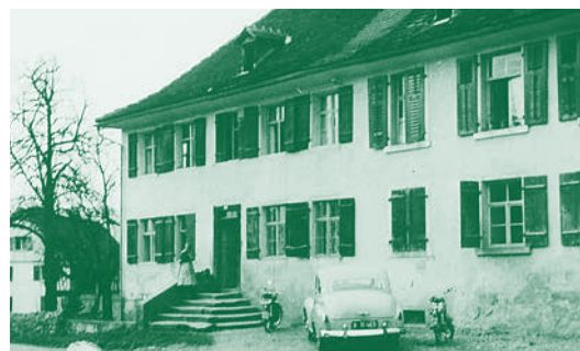
„Polentahof“ um 1950