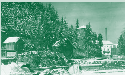
Die Trifitanlage mit Eichenhaus, oberen „Läden“ und Wasserschloss für den Zufluss zur Turbine, 1928