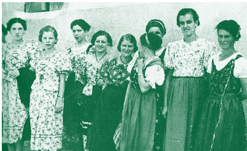
Betriebsausflug der Spinnerei im Dirndl aus Rhombergstoffen 1937

Die Arbeit an der Karde galt als Männerarbeit, während „Drossel“ und „Flyer“ meist von Frauen bedient wurden. Die Karde war eine Vorbereitungsmaschine, die zum Auflösen des Faserguts der Baumwolle diente. Die „Drossel“ wurde nach dem singenden Geräusch der sich mit hoher Umlaufzahl drehenden Spindeln benannt. „Flyer“ bezeichnete man eine Vorspinnmaschine in der Garn-