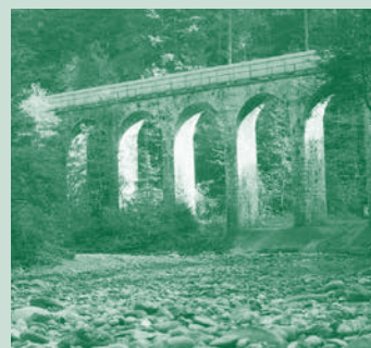
Das alte Aquädukt und die Wasserleitung vor und nach der Sprengung 1981