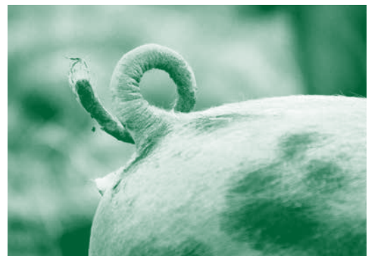
Artgerechte Haltung von Duroc-Schweinen

Der kleine Hofladen direkt beim Eingang zum Bauernhof erinnert eher an einen kleinen Holzschopf, als an einen Laden. Wer jedoch den rund 20 Quadratmeter großen Raum betritt, staunt nicht schlecht: Leise, volkstümliche Hintergrundmusik, ein plätschernder