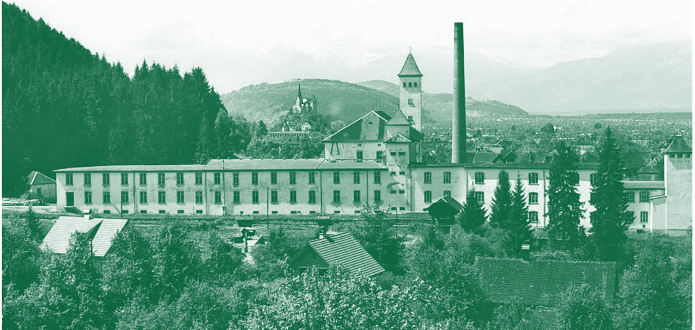
Spinnerei Rankweil, 1957

Von der textilen Vergangenheit Rankweils sind viele Spuren noch heute zu sehen: Aus der Hochphase um 1900 die „Häusle-Villa“ (Stickerei Marte), das Vereinshaus (Stickerei Jubele/Rauch) und als einzigartiges Industriedenkmal die Spinnerei im Oberdorf.