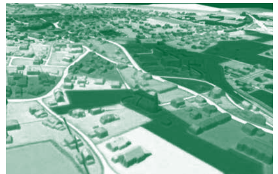
Auf das Modell lassen sich verschiedene Szenarien projizieren.