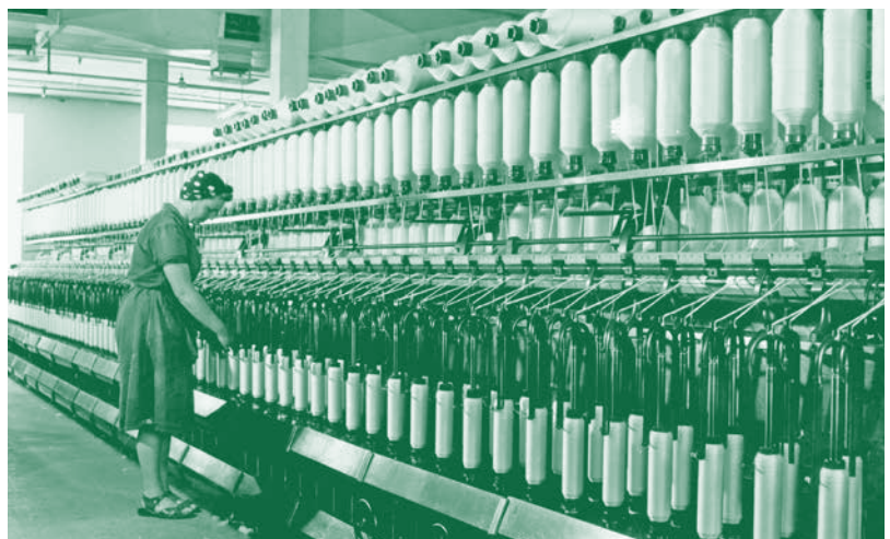
Grobflyer um 1955