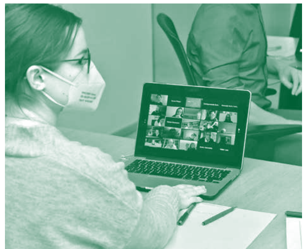
Der vierte und letzte Workshop zur Ortskernentwicklung fand digital statt.

Sämtliche Top-Maßnahmen werden sich in vier Begegnungsräumen abspielen: Der Marktplatz und die Ringstraße Süd werden zu belebten Treffpunkten für Bildung, Kultur und Veranstaltungen sowie Anziehungspunkte für die gesamte Region. Der Liebfrauenberg soll als Wallfahrtsort zeitgemäß auf spirituelle Erlebnisse ausgerichtet sein. Die Bahnhofstraße wird zur begrünten Flanierallee, einer Begegnungszone mit einem vielfältigen Angebot für Einkauf und Gastronomie. Die Ringstraße hingegen soll als junge, aktive, geschäftige und pulsierende Begegnungszone gelten. Arbeiten und Wohnen wird kreativ neu gedacht.