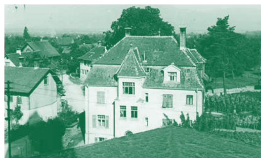
Direktorenvilla um 1950