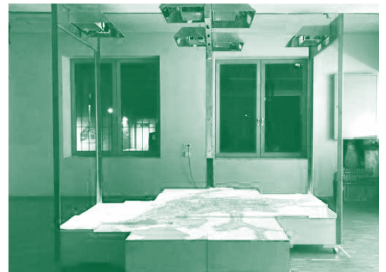
Anhand dieses interaktiven Modells soll die Entwicklung des Ortsteils Brederis geplant werden.

Über das ganze Jahr verteilt wird es 15 Termine geben, bei welchen die Bevölkerung unkompliziert an den Planungen mitwirken, die Ergebnisse kommentieren und eigene Vorschläge einbringen kann. „Den jeweils aktuellen Projektstand veröffentlichen wir laufend in unseren Gemeindemedien – on- und offline“, erklärt die Bürgermeisterin, welche gleichzeitig an alle Bewohner*innen im Ortsteil Brederis appelliert: „Bitte machen Sie mit und zeigen Sie uns, wie sie künftig in Brederis wohnen und arbeiten möchten. Denn nur, wer seine Stimme erhebt, kann auch gehört werden.“