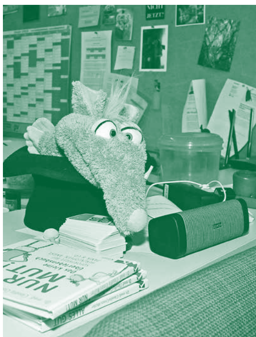
Spielerische Elemente im Raum des Sozialarbeiters