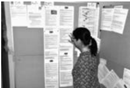
Im Rathaus Rankweil laufen die Fäden für das Krisenmanagement zusammen.