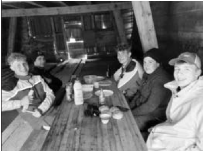
Gemütlicher Abschluss nach getaner Arbeit