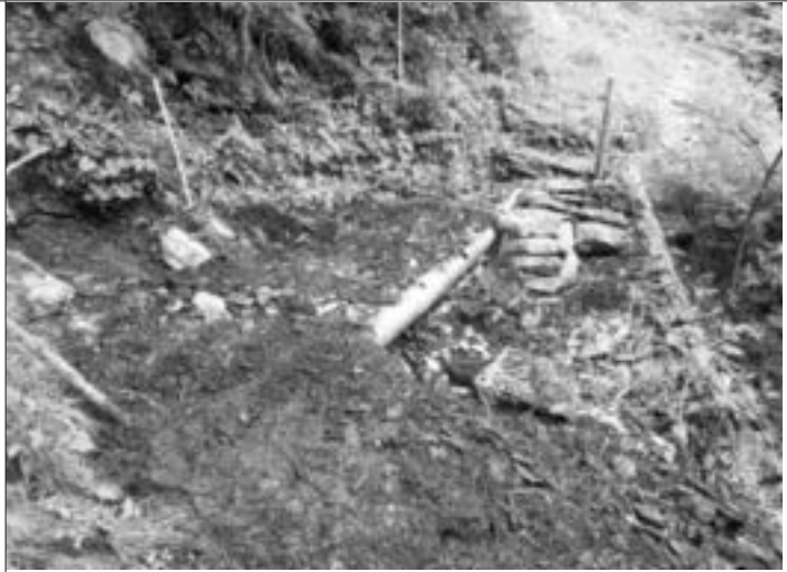
Weginstandsetzung - Übergang eines Tobels